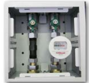
Abb. 1 Lieferumfang ohne Wasserzähler

Inkl. Schlitzschloss mit zwei Schlüsseln