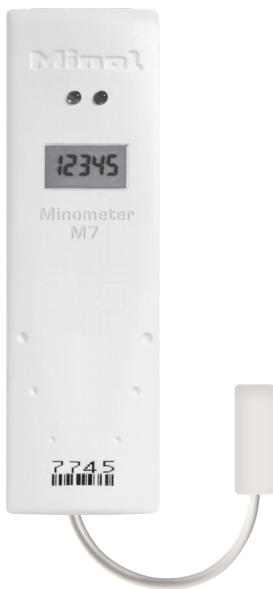
Minol Minometer® M7 Splitt Für schwer zugängliche bzw. verbaute Heizkörper