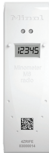
Minol Minometer® M8 radio* Der Funk-Heizkostenverteiler zur Einbindung in das Funksystem Minol Connect