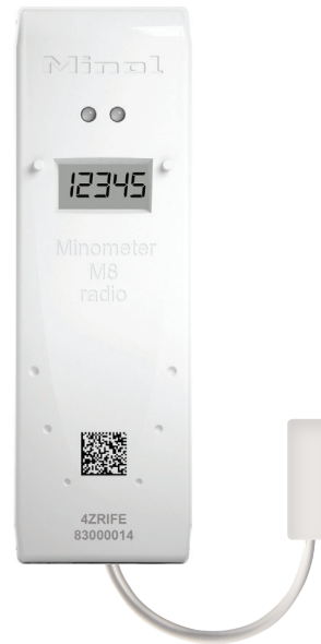
Minol Minometer® M8 radio splitt* Der Funk-Heizkostenverteiler für schwer zugängliche bzw. verbaute Heizkörper

*Technische Details zum Minol Minometer® M8 radio finden Sie auf einem separatem Datenblatt.