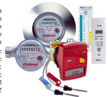
Messgeräte zur Verbrauchserfassung für Heizung, Warm- und Kaltwasser.

§ 7 (2): ... Zu den Kosten des Betriebs der zentralen Heizanlage gehören die Kosten der verbrauchten Brennstoffe ... die Kosten der Anmietung oder anderer Arten der Gebrauchsüberlassung einer Ausstattung zur Verbrauchserfassung sowie die Kosten der Verwendung einer Ausstattung zur Verbrauchserfassung einschließlich der Kosten der Berechnung und Aufteilung.