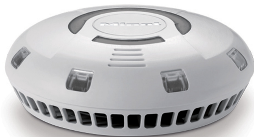
Abb. 1: Rauchwarnmelder sollten in keiner Wohnung fehlen. Sie schlagen bei Bränden zuverlässig Alarm und können so Leben retten.

Rauchwarnmelder erforderlich, wenn sowohl deren Fläche 16 m 2 als auch deren Länge und Breite jeweils 2 m übersteigen. In solchen Räumen sind dann zwei Rauchwarnmelder zu installieren.