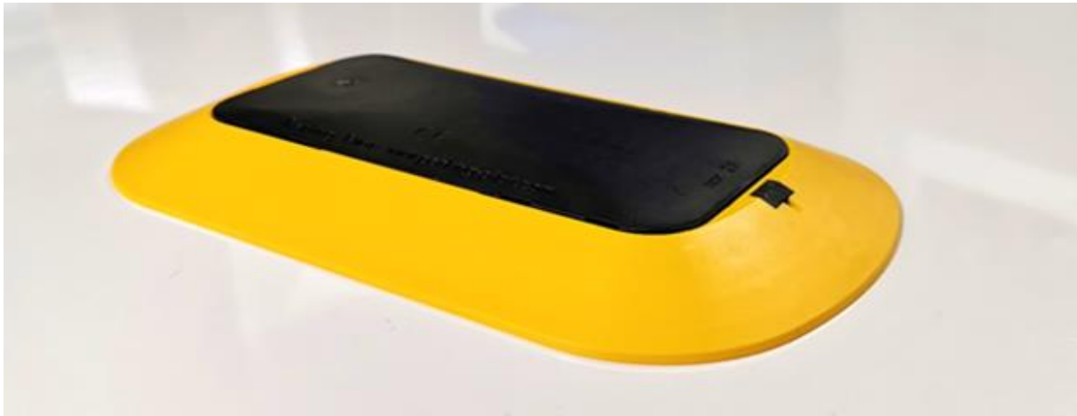
Abbildung 1: Bodensensor